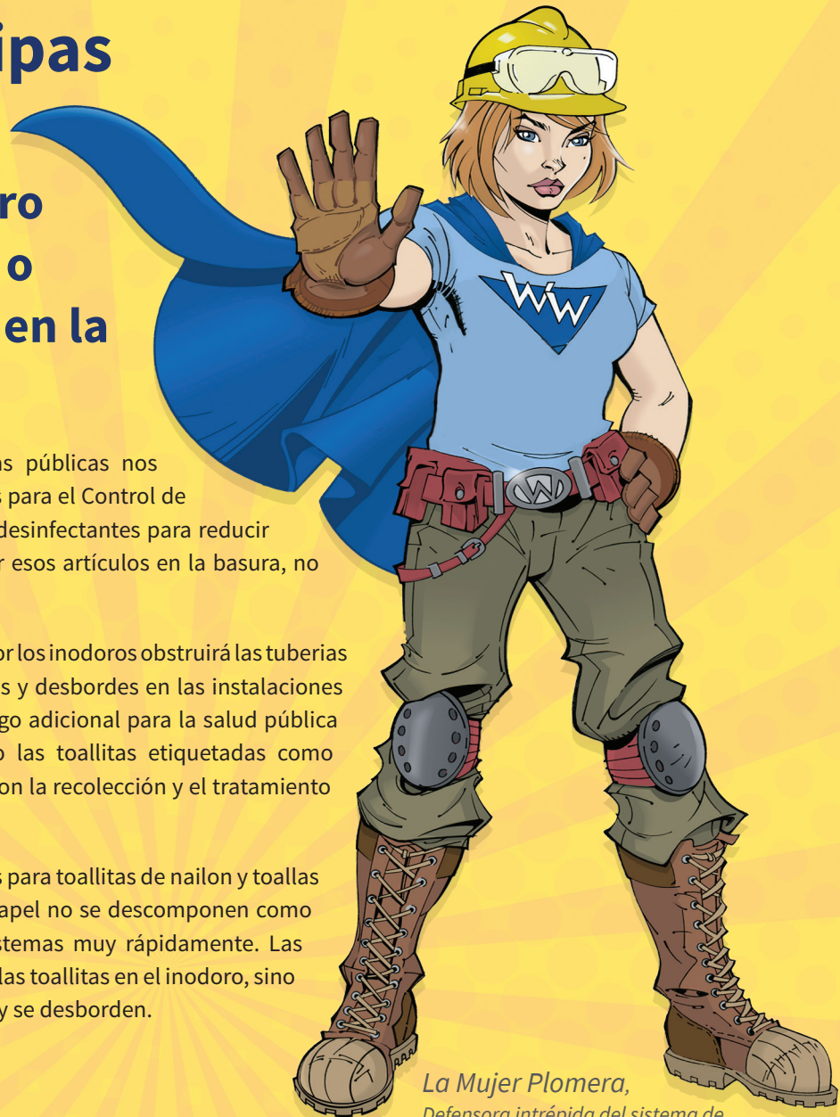
La Mujer Plomera, Defensora intrépida del sistema de drenaje alcantarillado

Por favor, no tire toallitas desinfectantes o toallas de papel por el inodoro.